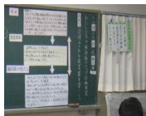
▲授業のユニバーサルデザイン化