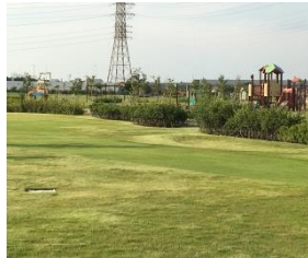
▲パークゴルフ場 ▼遊具

環境経済部長 ①登録業者による入札 ②県警や道路管理者と協議を行う ③使用料は市内外を分けて設定予定 ④広報誌及びホームページ、SNS等活用 ⑤施設管理のため鍵の管理など難しい面もあるが、地元の要望もあり、管理棟にソー