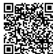
▲パークゴルフHP ※画像をクリック

環境経済部長 日除けは検討を進める。アイスも販売予定。動画の作成などで周知を図る。健康増進のメリット構築や多世代交流イベントの企画等を検討してまいる。