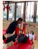
リハビリ施設の 視察