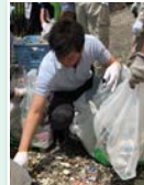
河川プラ ゴミ拾い