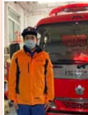
消防団 「第七分団」所属