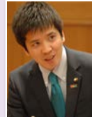
市政への 一般質問