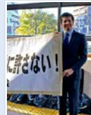
いじめ撲滅 キャンペーン